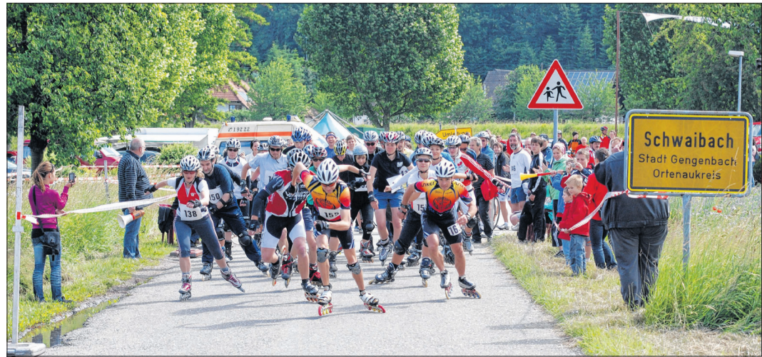
Bei der Sommer-Stafette des SSV Schwaibach gilt: Hauptsache in Bewegung! Die Teilnehmer messen sich in drei Disziplinen.

Die 40. Fußballstadtmesterschaft für Hobby- Vereins- oder Firmenmannschaften um den Sparkassen-Cup finden am 14. und 15. Juni statt. Am Donnerstag 14. Juni spielen ab 18 Uhr in Gruppe 1 Schlosse rei Bross, BLG Logistik, MSF Schwaibach, Bergwaldeifel und FC Bergach. In Gruppe 2 kämpfen Willi Wuff, FC Hollywood, Sonntagkicker, Narrenzunft Gengenbach, Elektro Schwarz und Zell um den Einzug in die Zwischenrunde und die Finalspiele am Freitag 15. Juni.